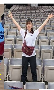
Angel Smile杯に参加させて頂きました